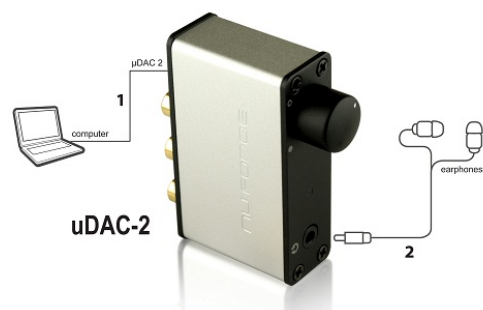
Cables and Jacks